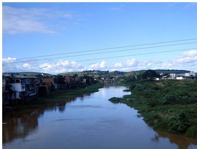
“Rio Una Passando Pela Cidade”

É conhecido como "Atenas Pernambucana", "Capital da Mata Sul" e "Terra dos Poetas", por ser o berço de ilustres e renomados poetas, romancistas, teatrólogos, jornalistas, médicos, religiosos, advogados, políticos, militares, artistas, músicos, etc., os quais ajudaram a projetar o município no restante do País. Trata-se de uma cidade bastante tradicional e muito importante na história do Estado de Pernambuco. Seu nome é também uma homenagem ao Quilombo dos Palmares , que se instalou no seu entorno e resistiu durante muito tempo sob o comando de Zumbi .