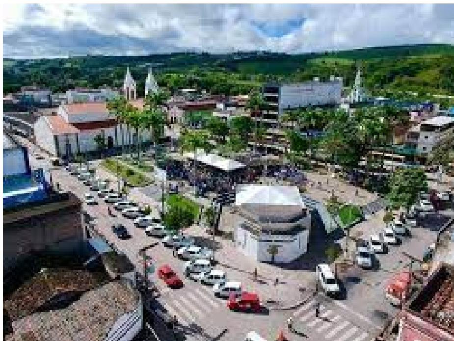
Vista Aerea da Praça central “ Dr. Paulo Paranhos”

A contratação de empresa para realização do show da Banda JONAS ESTICADO terá objetivo de atrair muitos admiradores , sendo uma das bandas que vem se destacando a cada dia no cenário musical, levando muita qualidade , profissionalismo e música boa para o seu público.