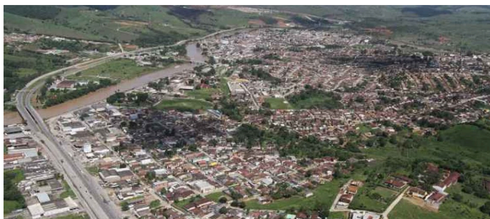
Vista Aerea Palmares - PE