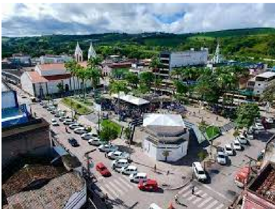
Vista Aerea da Praça central “ Dr. Paulo Paranhos”

A contratação de empresa para realização do show da Banda WILL terá objetivo de atrair muitos admiradores , sendo uma das bandas que vem se destacando a cada dia no cenário musical, levando muita qualidade , profissionalismo e música boa para o seu público.